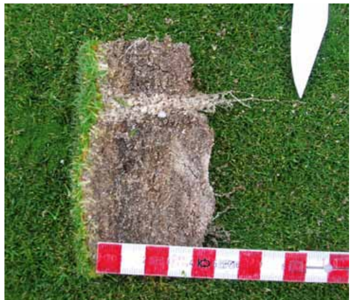
▲ Ausbildung eines vitalen Wurzelwachstums in Belüftungslöchern (z.B. durch Aerifizieren)