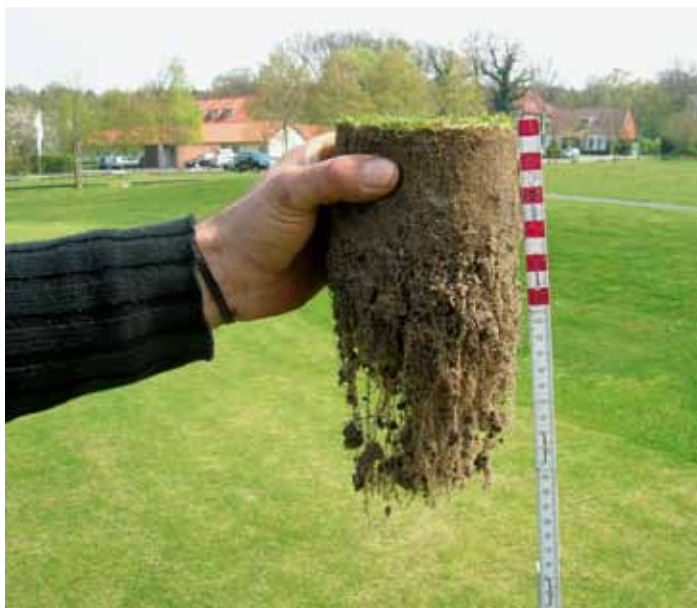
▲ Gut durchwurzelte Rasentragschicht eines Golfgrüns