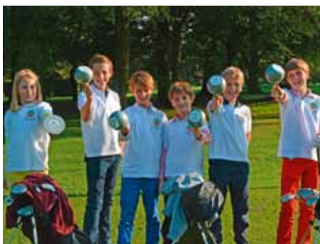
▲ Jugend mit Talent Tee

Es waren beim Verbandstag mit 41 Vertretern aus 26 Clubs nur wenige Mitglieder anwesend, um ihr Interesse an der Arbeit des Golfverbandes NRW zu zeigen und aktiv an der Gestaltung der Verbandsarbeit mitzuwirken. Wir werden demnächst die Mitglieder befragen, warum das Interesse am Verbandstag nicht größer ist, denn das Präsidium des GV NRW möchte, dass